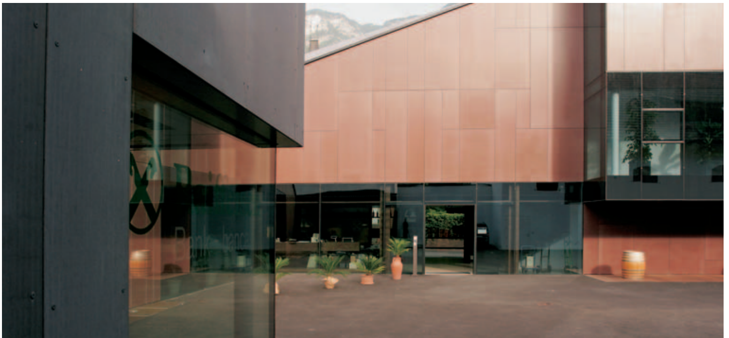
FACCIATA IN CALCESTRUZZO CON FIBRE DI VETRO